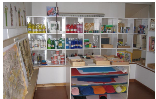
Compacte creatieve hoek met materiaal op kindhoogte