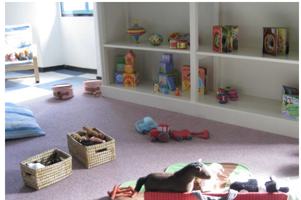
Materiaal op kindhoogte