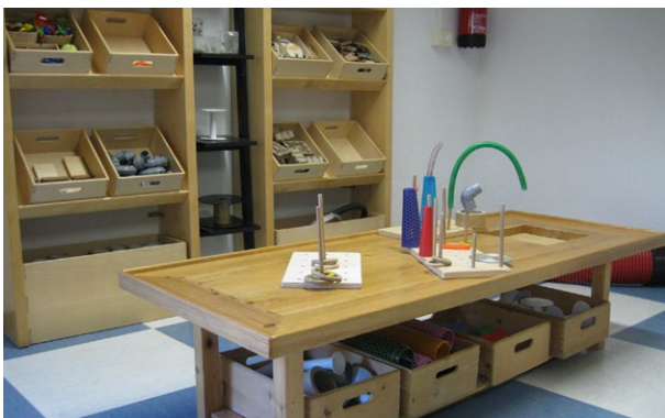
Stoere werkplek met echte materialen